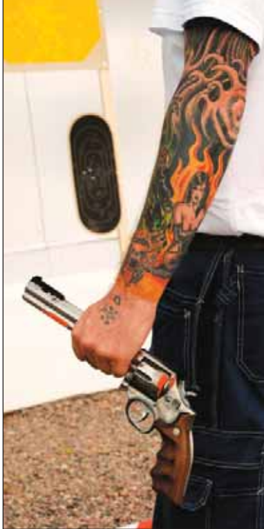
Eld och lågor för Magnumskytte.